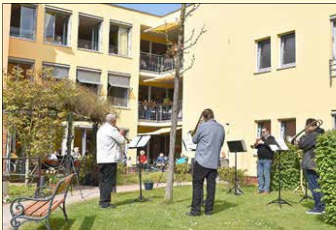
Gartenkonzert im ASB-Seniorenheim „Am Park“ in Böhlen mit dem LSO-Quintett „Saxonia Brass“ des Leipziger Sinfonieorchesters

Musik erreicht die Herzen in jedem Alter - das konnte man an diesem sonnigen Nachmittag ganz deutlich spüren. Der ASB bedankt sich bei den Musikern für dieses geschenkte Hörvergnügen an die Senioren.