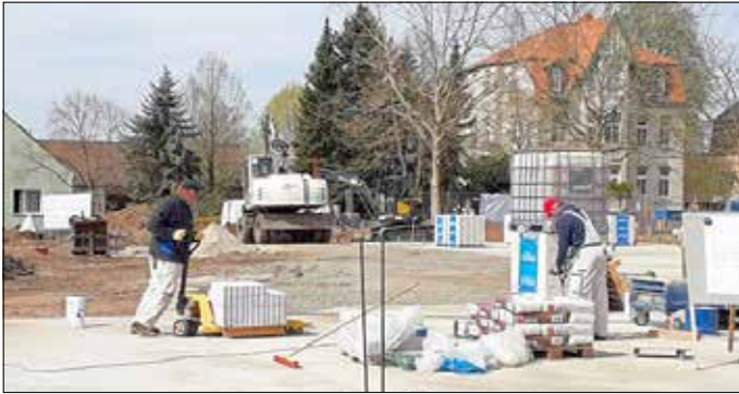
... zwei Wochen später – 30. April: Blick vom Mehrgenerationenhaus – der Rohbau nimmt weiter Gestalt an