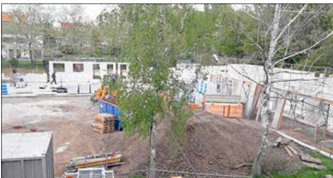
Noch im Mai werden die Zimmerleute die Baustelle übernehmen und den Dachstuhl errichten.