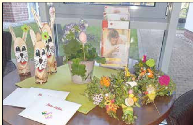
Viele schöne Ostergrüße erreichten die Bewohner des ASB-Seniorenheims in Böhlen